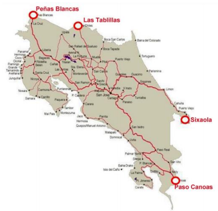
Imagen 3. Principales Puestos Fronterizos Terrestres en Costa Rica