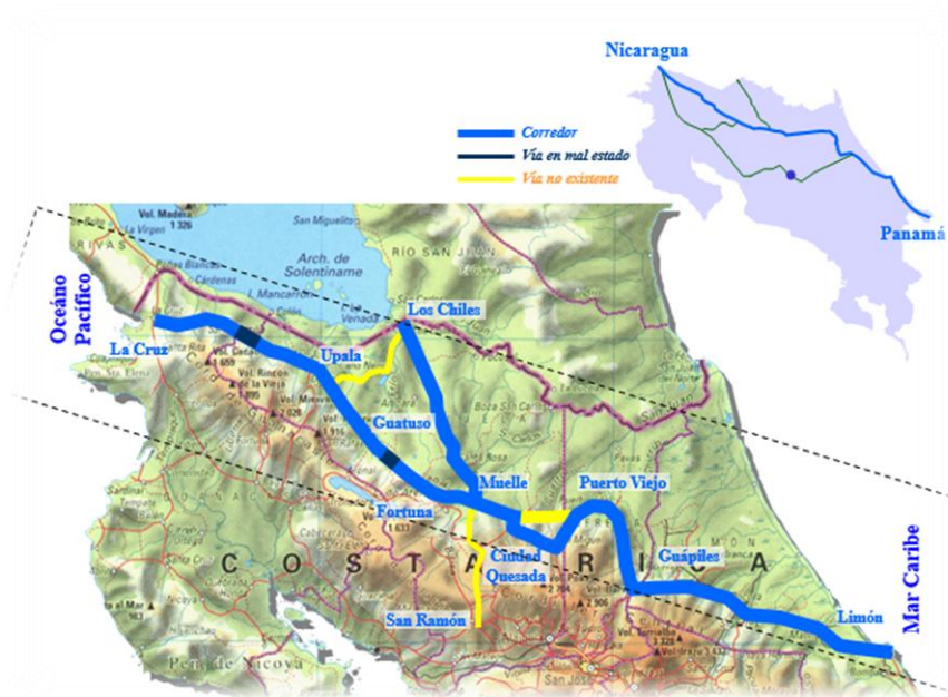
Imagen 5. Ubicación del Puesto Aduanero Las Tablillas y la Aduana de Peñas Blancas