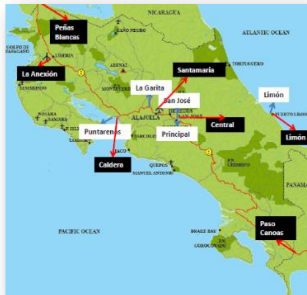
Imagen 2: Distribución de las Aduanas en el Territorio Nacional

Comprende de la provincia de San José, los cantones de Puriscal, Mora y Santa Ana. De la provincia de Heredia, los cantones de Heredia, Barva, Santa Bárbara, Flores, Santo Domingo, San Pablo, Sarapiquí. De la provincia de Alajuela, el cantón de Alajuela, San Ramón, Grecia, Atenas, Naranjo, Palmares, Poás, Alfaro Ruiz y Valverde Vega. También tiene a su cargo el Puesto de Aduana Tobías Bolaños (pp.171-172).