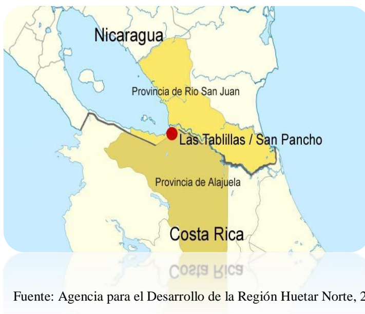
Imagen 4. Ubicación del Paso Las Tablillas-San Pancho