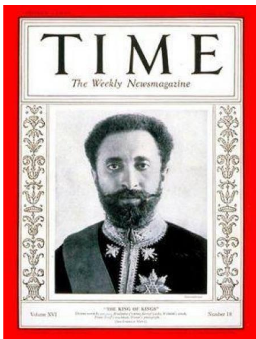
Ilustración 2 Figura de Haile Selassie