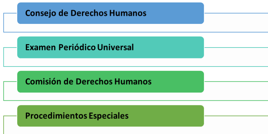
Gráfico 1. Órganos basados en la Carta de las Naciones.