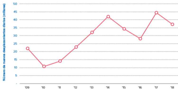
Gráfico 3 | Promedio de nuevos desplazamientos (por día) | 2009-2018

Tendencias Globales Desplazamiento Forzado en 2018