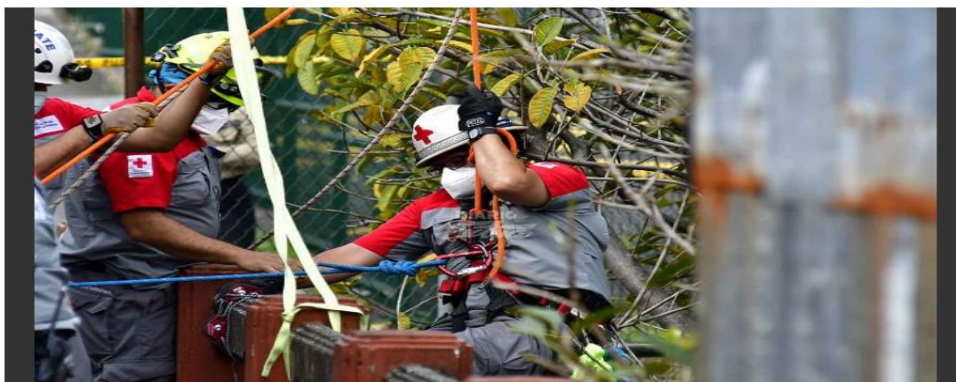
Los socorristas usaron equipo especial para alcanzar el cuerpo.

Lugareños apodan al sitio como el cementerio de indigentes, San José