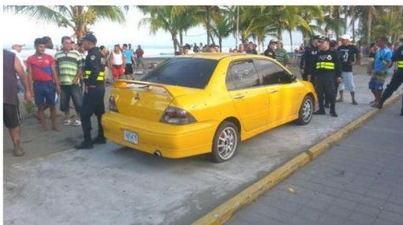
Este automóvil presentaba 60 orificios de bala, informó el OIJ. La policía informó que perteneció a un hombre de apellido Peña, quien resultó herido. (BRIK CASCAÑES)

La venganza o un ajuste de cuentas entre bandas criminales es, para el Organismo de Investigación Judicial (OIJ), el origen de la balacera que la tarde de este domingo se produjo en la playa de Cieneguita, Limón.