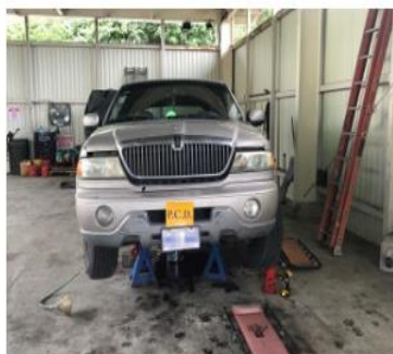
La camioneta es marca Lincoln Navigator, modelo 2002, y pertenece a un costarricense que vive en Liberia.

Oficiales de la Policía de Control de Drogas (PCD) descubrieron 18 kilos de cocaína escondidos en la caja de cambios de una camioneta marca Lincoln Navigator, modelo 2002, cuando su dueño intentó pasar con el carro por el puesto fronterizo de Peñas Blancas, en La Cruz, Guanacaste.