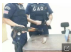
El Grupo de Apoyo Operacional de la Fuerza Pública decomisó armas de fuego y drogas.

POR MANUEL HERRERA F., manuel.herrera@nacion.com