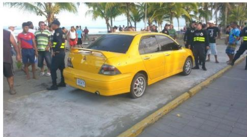
En octubre del año pasado, se prolongó una búsqueda en Cartagena, Limón, que provocó la muerte de cinco personas de 11, 15, 21, 33 y 38 años de edad. Esta hecho fue producto de la lucha de organizaciones dedicadas al narcotráfico. (MEDIUNO)

FOR CARLOS ARGUEDAS C. carlosgarcia@nacion.com