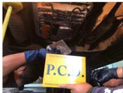
Los policías encontraron 15 paquetes con droga que pesaron 18 kilos con 79 gramos

Esa alteración permitía que quedara un espacio en el cual escondieron la droga. La cocaína de alta pureza estaba distribuida en 15 paquetes, que en total sumaron 18 kilos con 79 gramos.