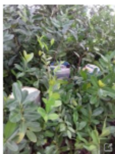
Entre la vegetación de Westfalia estaban los estacionos cargados de gasolina.

La Fuerza Pública y el Servicio Nacional de Guardacostas encontraron 2.700 litros de gasolina en la bocana de Westfalia, cantón central de Limón.