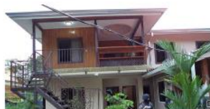
Imagen sin título - CN

Los capturados estaban siendo indagados en la tarde de ayer. La Fiscalía solicitó prisión como medida cautelar.