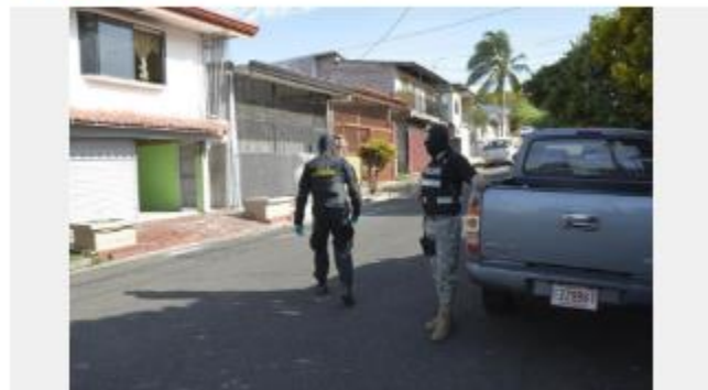
Agentes del OIJ allanaron varias viviendas en el sector de Copán, en Montecillos de Alajuela por la venta de drogas.

La mañana de este miércoles unos 50 agentes del Organismo de Investigación Judicial (OIJ) y de la Policía Municipal de Alajuela allanaron 10 viviendas por venta de drogas en el sector conocido como Copán, en Montecillos de Alajuela.