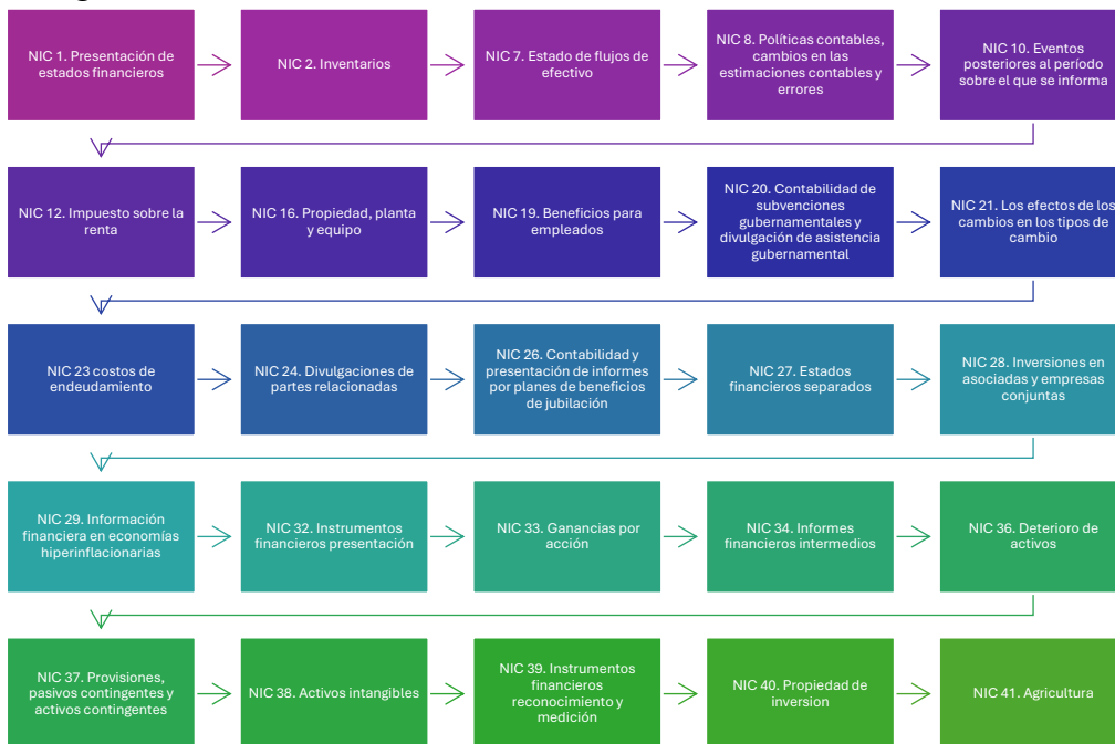
Imagen 2. Normas Internacionales de Contabilidad actuales

Murillo, basado en IFRS Accounting Standards (2024).