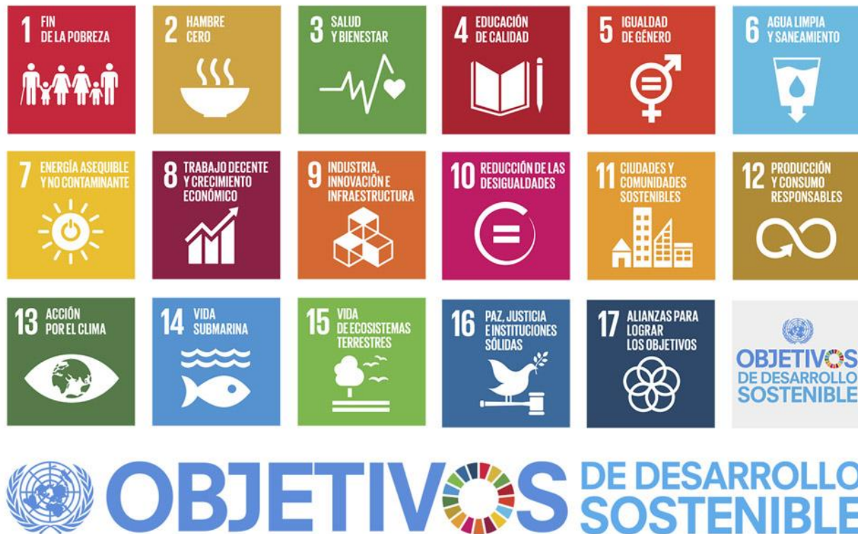
Figura 1. Objetivos del Desarrollo Sostenible