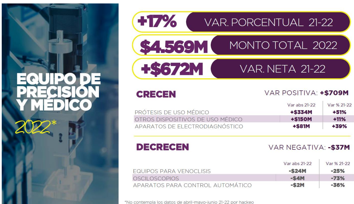
Imagen 1. Comportamiento del equipo de precisión y médico