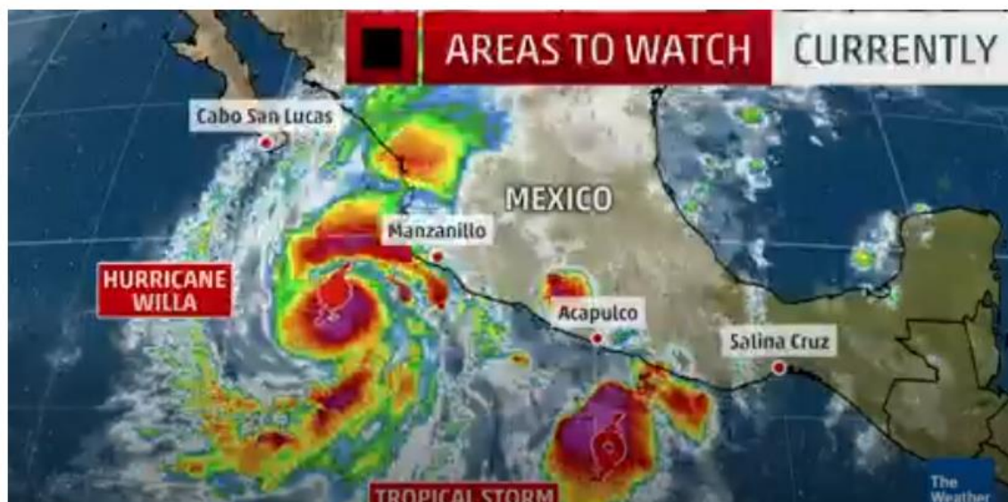
Imagen 2. Huracán en puerto Manzanillo

Por ejemplo, el puerto de Manzanillo, México, el cual es uno de los principales receptores de carga del continente asiático por la cantidad de volumen que es capaz de trabajar, sufre en el tercer cuatrimestre del 2018 una congestión portuaria bastante importante, la cual genera atrasos hasta de un mes y medio en las mercancías provenientes del Occidente con destino final a Costa Rica. Aunado a la mala situación que se vive en ese momento, se presenta una tormenta tropical que impide el arribo de los buques.