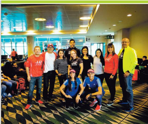
Holistic Runners es uno de los equipos ticos que viajó a Chicago, Estados Unidos, para competir el domingo en la maratón de esa ciudad, considerada una de las seis más importantes del orbe.

HABRÁ 522 COSTARRICENSES CORRIENDO, SEGÚN EMBAJADA