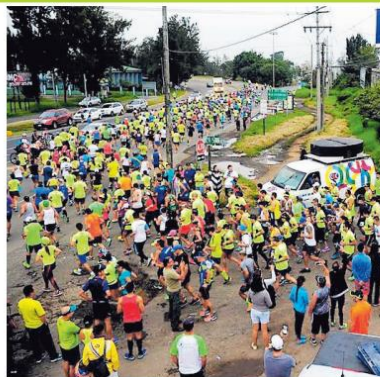
La Media Maratón Herbalife parte desde Cartago y concluye en el centro comercial Momentum Pinares. AP/60

La inscripción para el GP Challenge tiene un costo de $80.