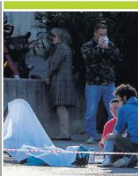
El pedalista italiano quedó tendido junto a su bicicleta.