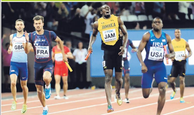
Usain Bolt tomó la estafeta y metros después se quejó de un dolor en la pierna que lo hizo detenerse en la carrera de 4x100.

LA PRUEBA DE 4X100 ERA LA ÚLTIMA DE SU CARRERA