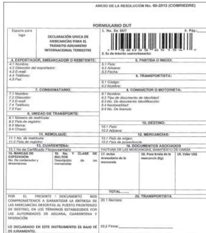
Ilustración 7: Declaración de transporte internacional