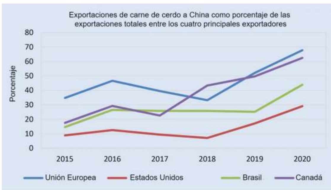
Ilustración 1: principales exportadores de carne de cerdo

Nota: Food and Agriculture Organization de las Naciones Unidas (FAO)