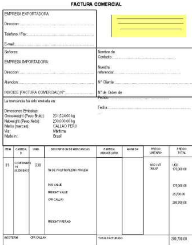
Ilustración 5: Factura comercial