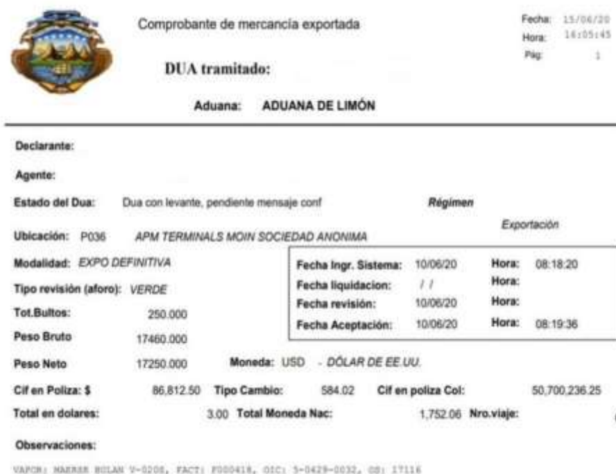
Ilustración 4: Declaración Única Aduanera

Nota: Servicio Nacional de Aduanas en el portal electrónico del TICA (2020)