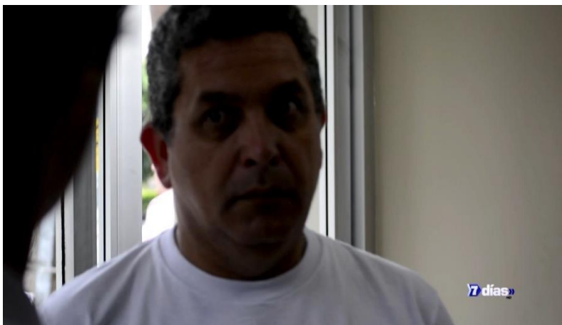
Apéndice K. Tabla 8. Sonido de los Reportajes del programa.