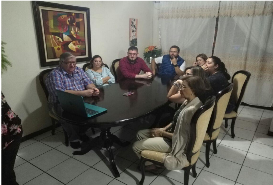
Apéndice R. Imagen 2. Participantes Grupo Focal 1