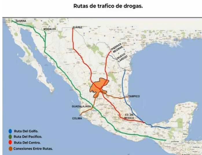
Figura 2: Rutas del tráfico de drogas a través de México.