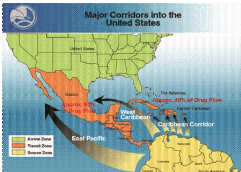
Figura 1: Principales rutas de la droga hacia los Estados Unidos desde Colombia.