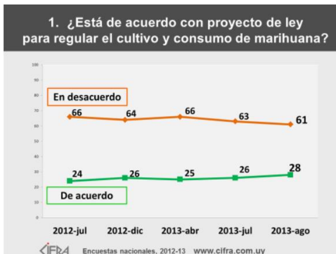
Figura 4: Apoyo a la legalización de la marihuana en Uruguay

caída de cinco puntos desde que fue propuesta por primera vez por el presidente José Mujica, en julio de 2012. El último sondeo confirma que hubo una clara, aunque leve, tendencia a la baja en la desaprobación de la ley en el año pasado (Ramsey, 2013).