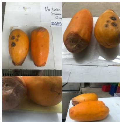
Ilustración 4: Primeros síntomas de Antracnosis