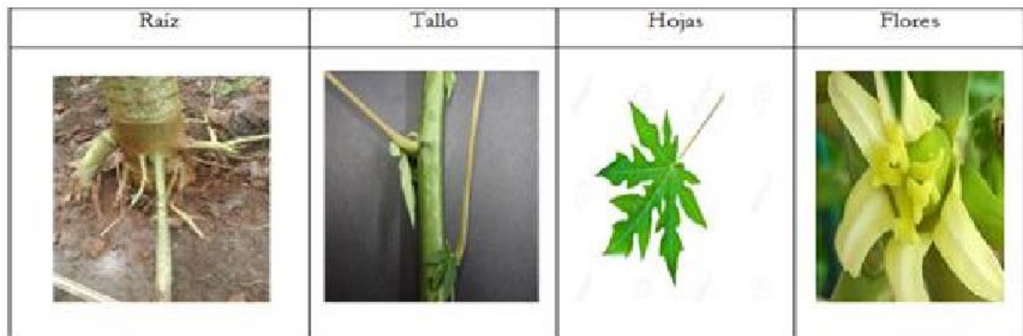
Ilustración 1: División morfológica de la papaya

Las flores crecen al mismo tiempo que la planta da frutos y se desarrollan debajo del tallo de las hojas, es decir en las axilas de estas, en forma de racimos. La planta está compuesta por tres tipos florales, las pistiladas, estaminadas o pistilo estaminadas, lo que produce plantas femeninas, masculinas y hermafroditas. Son de color blanco cuando alcanzan la madurez, conformadas por cinco pétalos y no poseen néctar. (Ariza et al. , 2010, p.15)