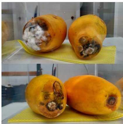
Ilustración 3: Papaya con moho causada por el hongo Colletotrichum gloeosporioides

Nota. Fotografía obtenida de PROCOMER, 2019