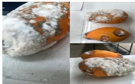
Ilustración 2: Papaya infectada de Antracnosis

En las siguientes imágenes se puede observar ejemplos de papayas infectadas con Antracnosis causada por el hongo C. gloeosporioides sensu lato . Las imágenes fueron tomadas de un estudio realizado por PROCOMER junto con la Universidad de Costa Rica y la empresa Plasma Innova, para retomar la comercialización de dicha fruta con mercados antiguos y nuevos. En ellas se pueden observar todos los síntomas descritos de la enfermedad Antracnosis.