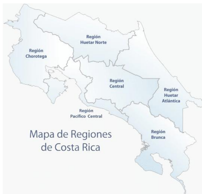
Ilustración 11. Región Pacífico Central

Nota: La ilustración anterior muestra la ubicación de la zona Pacífico Central, esto de acuerdo con un informe realizado por El Observatorio (2025). Recuperado de https://observador.cr/regiones-socioeconomicas-de-costa-rica-tendran-nuevo-mapa/