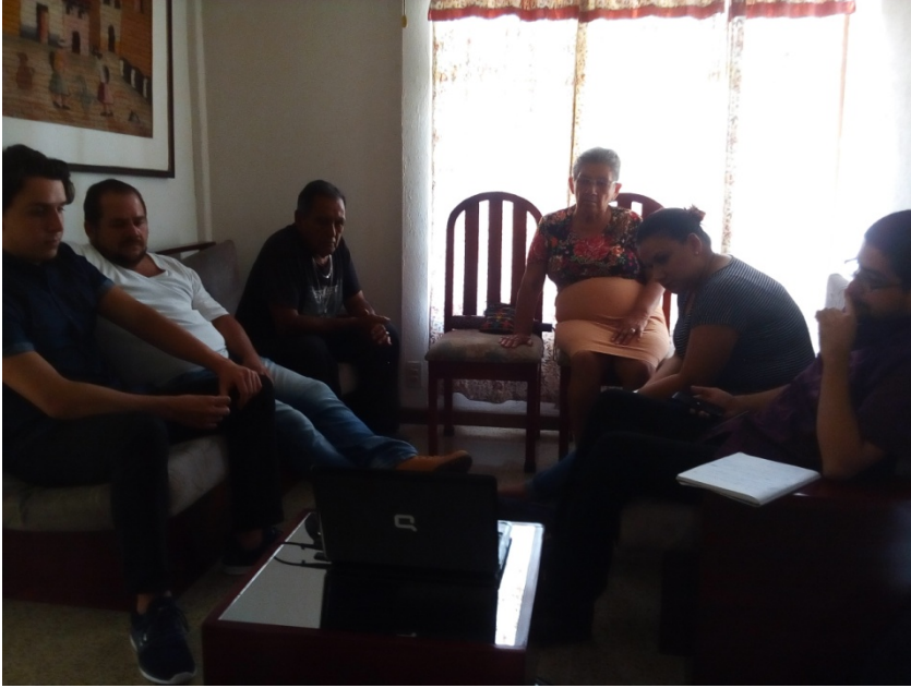
Apéndice I. Imagen 7 Grupo Focal II.