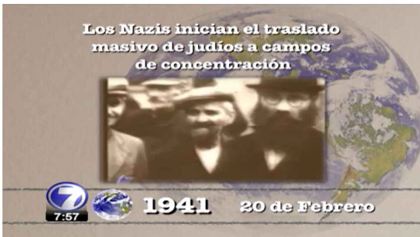
Apéndice D. Imagen 4 Hoy en la historia, santoral.