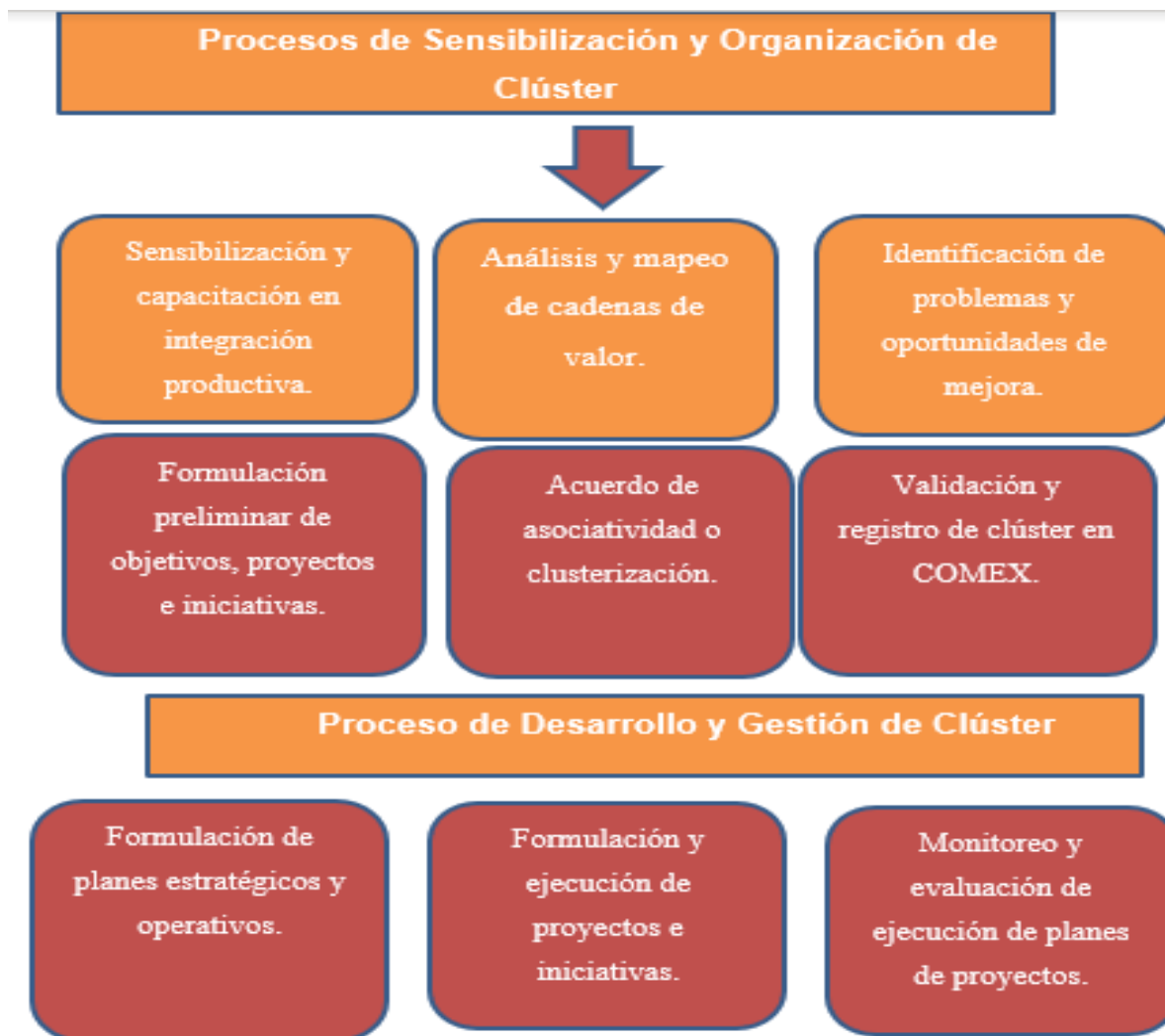
Gráfico 1: Proceso de promoción, conformación y desarrollo de un clúster

Nota: Libro blanco para una política de clústeres en Costa Rica promoviendo la innovación y la productividad a través de una mayor articulación productiva (2018)