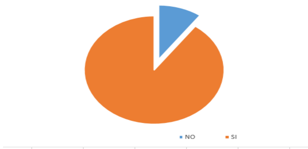
GRAFICO 1 conocimiento del impuesto sobre la renta

El siguiente gráfico representa el conocimiento que tienen del impuesto sobre la renta, los 3 SP de esta investigación.