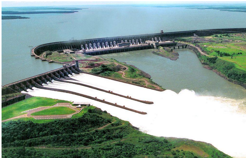
Ilustración 5 Central Hidroeléctrica de Itaipú en la frontera de Brasil y Paraguay

Además, la energía hidroeléctrica es un tipo de energía que es de fácil acceso y que genera electricidad de forma más barata en la actualidad, debido a que su fuente de energía es el agua que está en movimiento. Es totalmente gratuita, sin olvidar que es una energía que se renueva cada año a través del deshielo y las precipitaciones (véase ilustración 5).