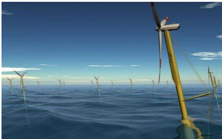
Ilustración 4 Aerogeneradores o molinos en el agua