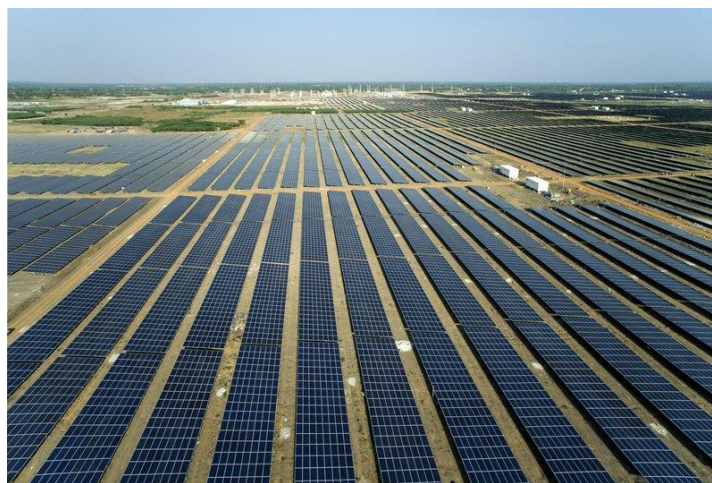
Ilustración 1 Tipo de paneles de energía solar fotovoltaica

El costo de instalación y mantenimiento de los paneles solares, cuya vida útil media es mayor a los 30 años, ha disminuido ostensiblemente en los últimos años, a medida que se desarrolla la tecnología fotovoltaica. Requiere de una inversión inicial y de pequeños gastos de operación, pero, una vez instalado el sistema fotovoltaico, el combustible es gratuito y de por vida. Véase ilustración 1. (Energía solar fotovoltaica, s/f).