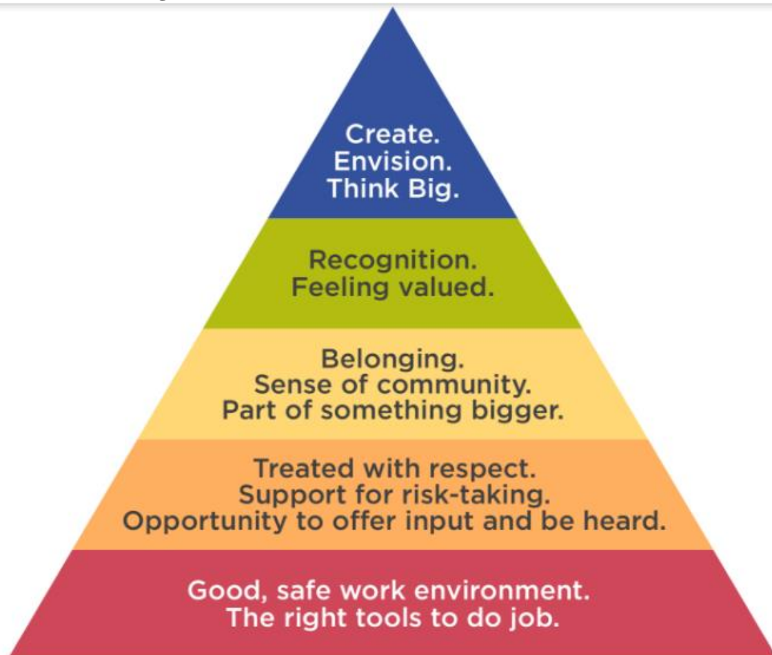
Figura 4. Pirámide de Maslow en el contexto laboral