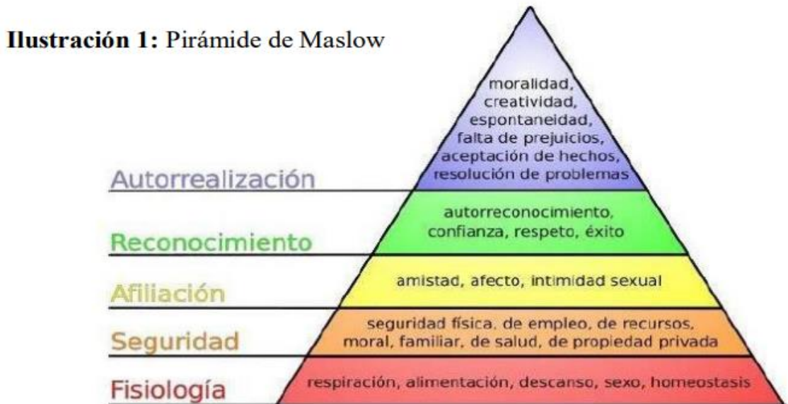
Figura 3. Pirámide de Maslow

Fuente: Motivation and Personality (1954)