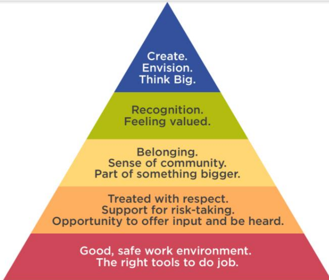
Figura 5. Pirámide de Maslow en el contexto laboral.

Fuente: figura obtenida de la referencia 56 .