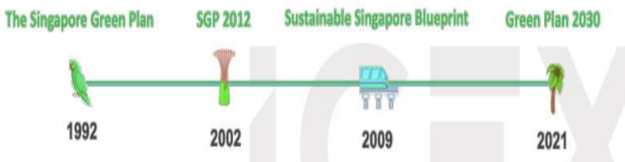
Imagen #1. Etapas del Plan de Desarrollo Sostenible 2030.

Nota: Figura obtenida de Campa y Ponte (2021).