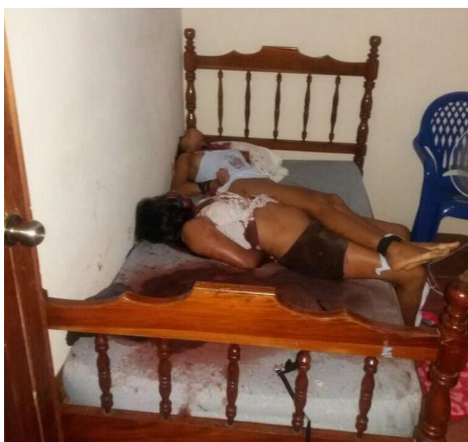
Figura 11: Fotografía de la masacre de Liberia

El director de La Prensa Libre señaló que las fotografías fueron publicadas una sola vez y que se hizo con el único fin de que se conociera la magnitud del hecho.