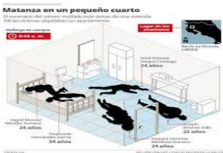
Figura 12: Representación gráfica