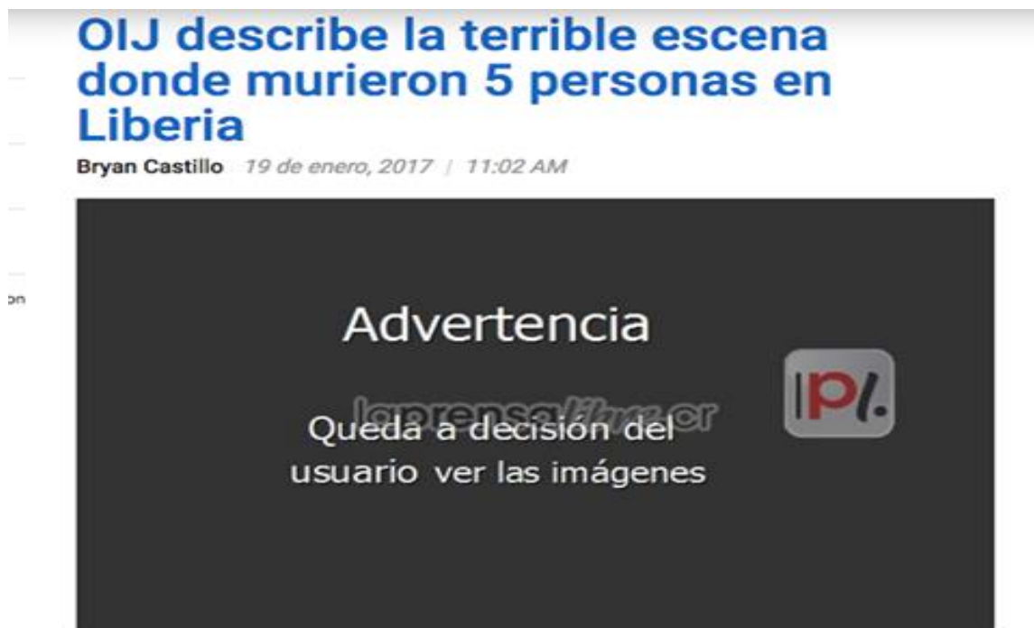
Figura 4: Rótulo de advertencia

Por otra parte, es posible observar, en la nube de palabras, expresiones sobresalientes como: medios, prensa, crimen, audiencia, Liberia, víctimas, dignidad, masacre, publicación, información, daño, foto y ética... Esos vocablos evidencian el tratamiento dado a la noticia.