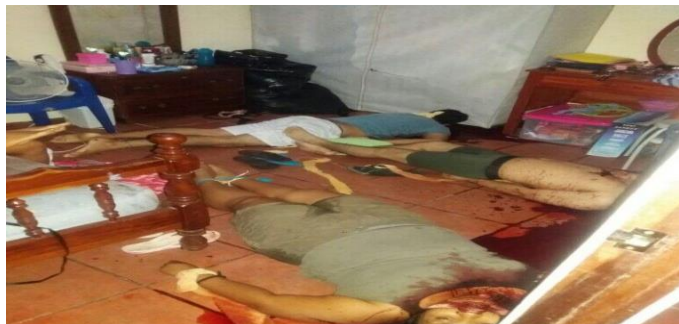
Figura 10: Imagen de la masacre de Liberia