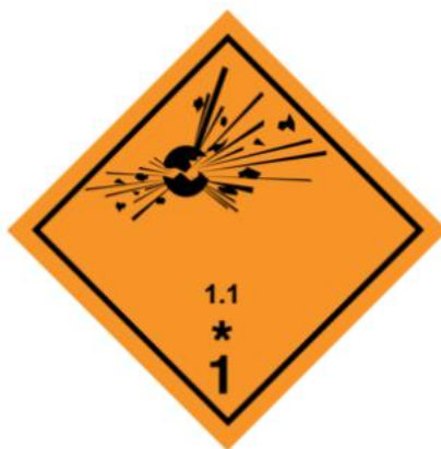
Ilustración 1. Mercancías explosivas.

Además, las materias pirotécnicas y objetos peligrosos son parte de la clase 1; estas sustancias están compuestas por químicos que provocan un resultado calórico.