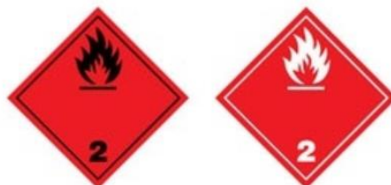
Ilustración 2. Gases