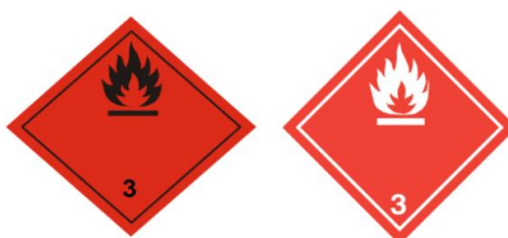
Ilustración 3. Líquidos inflamables.

Estas mercancías se derivan del petróleo; corresponden, por ejemplo, a la gasolina o el queroseno. El trato de estos líquidos inflamables debe tener su debido control, ya que algún mal movimiento puede provocar la explosión. Algunas de las materias que se dividen para esta clase son: materias líquidas explosivas desensibilizadas, materias líquidas inflamables y materias sólidas fundidas, que cuenten con algún punto de inflamación y líquidos según la definición del ADR, líquidos con presiones muy altas (TRANSEOP, 2021).