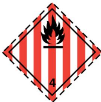
Ilustración 4. Materias sólidas inflamables, autorreactivas y sólidas explosivas desensibilizadas.

Se tiene que considerar que estas materias pueden llegar a experimentar dos cambios para que sean inflamables; la primera opción que se tiene, es la inflamación espontánea, en donde las mezclas se calientan sin tener algún contacto con la energía. Después existen las que tienen contacto con el agua y desprenden gases inflamables, como lo menciona su nombre por la reacción con el agua, generan gases de este tipo (TRANSEOP, 2021).