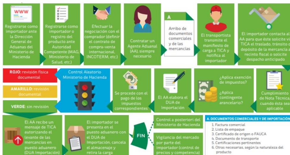
Ilustración 11. Proceso logístico de importación de mercancías.

y los pilares de este proceso, que son todas aquellas personas que desde la parte analítica hasta el transporte y manipulación, cumplen con distintos estándares.