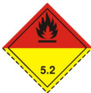
Ilustración 6. Peróxidos Orgánicos.