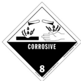
Ilustración 9. Materias corrosivas.