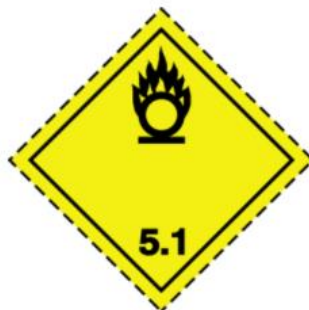
Ilustración 5. Agentes Oxidantes.