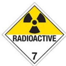
Ilustración 8. Materias radioactivas.

En función de los cambios de sus átomos estas mercancías emiten una radiación causando cambios químicos y biológicos de forma que pueden producir cambios y daños en un cuerpo. Hay algunos materiales radiactivos que pueden tener cierto grado de peligrosidad e incluso requerir de embalajes especiales, por lo que es muy importante que estén señaladas correctamente (parr.7).