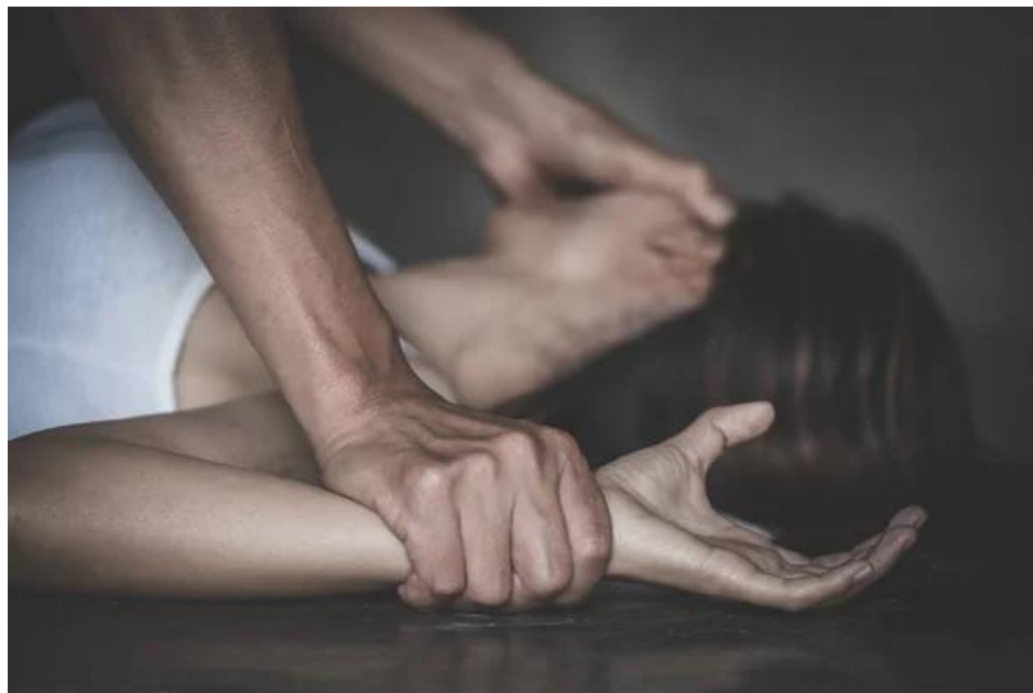
Mujer sufre violencia doméstica tipo sexual

Nota: mano de hombre sosteniendo una mano de mujer para violación y abuso sexual.