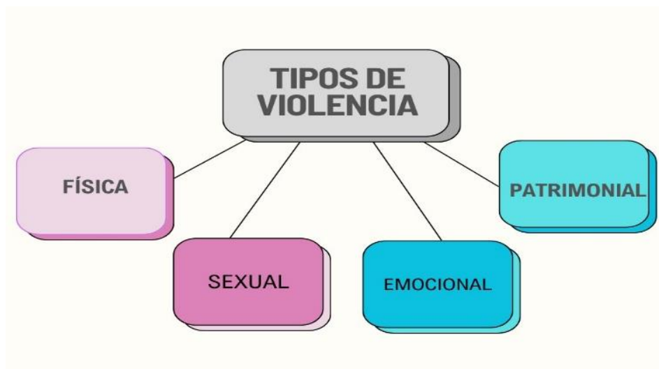
Esquema de los tipos de violencia

Nota: Elaboración propia. Clasificación en la que se genera la violencia doméstica.