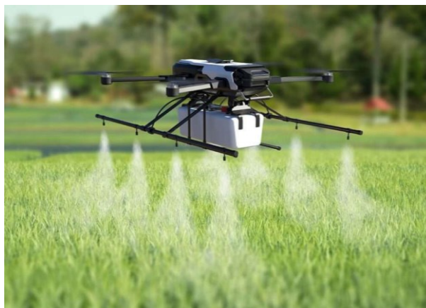
Figura 14. Drones Fumigadores

Según las necesidades de las plantaciones, entrarían en acción los drones fumigadores, los cuales consisten en multicopteros de gran envergadura y potencia, capaces de fumigar hasta 10 hectáreas por hora, como el nuevo dron agrícola T16 de DJI, con tanque de 16 litros, que rocía 6,5 metros a una velocidad de 4,8 litros / minuto. El DJI T16 es todo un gigante del cielo que vuela sobre huertos y laderas, además reconoce y aplica tratamiento sobre cada árbol (accesorios, 2021).