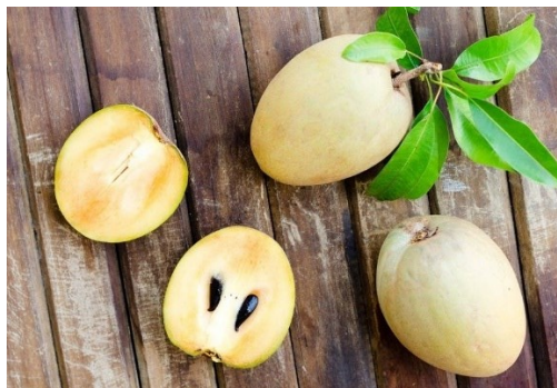
Figura 6. Níspero zapotillo

Es una especie de árbol frutal que pertenece a la familia Sapotaceae. Es nativo de América Central y del norte de Sudamérica. El níspero zapotillo produce frutos que son conocidos por diversos nombres, como zapote, chicozapote, sapote, níspero; entre otros. El género está muy extendido en todas las regiones tropicales del mundo.