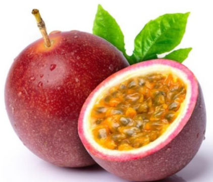
Figura 5. Maracuyá

El maracuyá, conocido como pasionaria, granadilla o fruto de la pasión, es fruta que aporta mucha energía, además de muchos otros beneficios para el organismo. Posee un atractivo exótico, es saludable, sabrosa y energética. Pasiflora adules es una planta trepadora nativa de Centroamérica y Sudamérica, originaria de la Amazonia, específicamente de Perú, Colombia, Ecuador, Venezuela, Brasil, Paraguay, Bolivia, Uruguay y norte de Argentina.