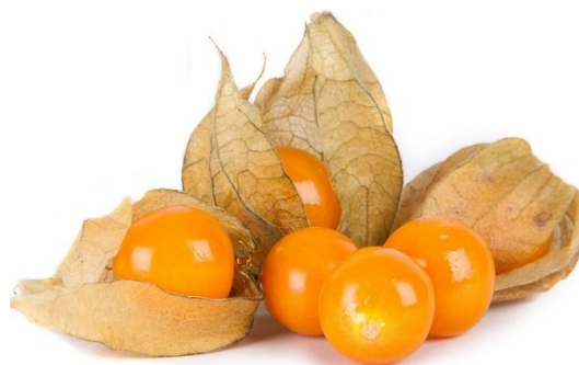
Figura 7. Uchuva

La uchuva ( Physalis peruviana ), también conocida como aguaymanto, uvilla, capulí, “goldenberry” ó “ground Cherry” en inglés, es una fruta originaria de la región andina de Sudamérica y se encuentra en países como Colombia, Perú y Ecuador. Esta fruta es conocida por su sabor agridulce y su característica cáscara en forma de linterna que rodea la fruta en su interior.