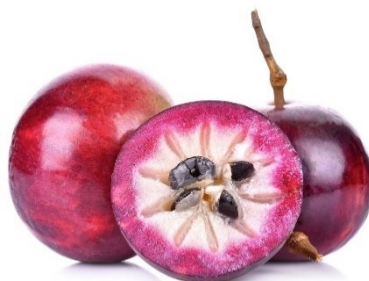
Figura 2. Caimito-manzana estrella

El Caimito es una fruta tropical perteneciente a la familia Sapotaceae , también es conocida con el nombre de manzana estrella. Se cultiva comúnmente en América del Sur y Asia, aunque se puede encontrar en Estados Unidos, específicamente en Puerto Rico, Hawái y Florida. Algunos consideran que tiene un sabor semejante al coco dulce. En la actualidad es una fruta comestible que puede ser cultivarse en huertos de hogar, debido a sus propiedades, fuentes de nutrientes, vitaminas y minerales.