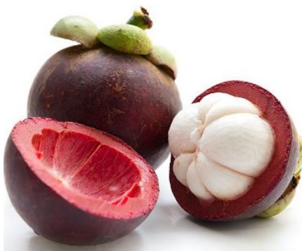
Figura 10. Mangostán

El mangostán es un árbol tropical perenne, originario de sudeste de Asia, el árbol alcanza un tamaño de 7 a 25 m de altura, posee un follaje de abundantes hojas verdes, su fruto comestible posee una corteza de profundo color púrpura rojizo cuando madura, además su carne comestible y con aroma peculiar e intenso se describe como dulce y agria, con sabor cítrico y textura de durazno. Existen más de 200 especies distintas de mangostán con una diferencia considerable.