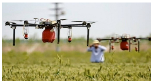
Figura 12. Drones para uso agrícola