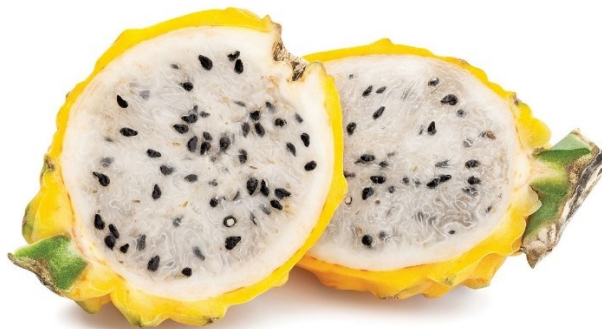
Figura 3. Pitahaya

La pitahaya también es conocida como la fruta del dragón. Pertenece a la familia de los cactus. La fruta tiene una forma ovalada con estructura rugosa. La piel es gruesa, suave y su color va desde el verde hasta amarillo mientras madura. La pulpa es de color blanco grisáceo con innumerables pequeñas semillas comestibles, de color negro. El sabor es más dulce que la pitaya roja. Según muchos estudios, es un antioxidante natural, que previene la acumulación de radicales libres en el organismo y está compuesta por más del 90% de agua, lo que la hace ideal para personas que buscan perder peso. Además, le aporta varias vitaminas y minerales esenciales, pero su principal aporte es consiste en ser un laxante natural al ayudar al buen funcionamiento del tracto digestivo por su contenido de fibra y otros nutrientes. Se recomienda su consumo para tratar el estreñimiento y otros problemas relacionados.