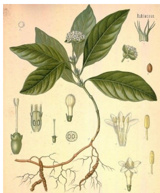
Figura 11. Ipecacuana

Es una planta herbácea, con un tallo semi-leñoso, delgado, y retorcido, de 20-30 cm de largo. Las flores, hermafroditas, son pequeñas y se encuentran en una inflorescencia terminal. El fruto es una baya pequeña y carnosa. El rizoma es tuberoso y posee una envoltura áspera, de 0,5-1,0 cm de grosor y de 15-17 cm de longitud. Una vez cosechado este pierde grosor y peso, pero no su aspecto anillado y torcido. La especie produce abundantes semillas, dispersadas por aves y posee una alta capacidad de reproducción vegetativa.