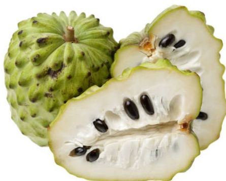
Figura 9. Anona

En países, como Perú, Chile, España y México, este fruto es conocido como chirimoya, mientras que en Costa Rica se le da el nombre de anona. En su etimología anona proviene del nombre popular Anón (nombre del árbol). El nombre chirimoya proviene del quechua, lengua