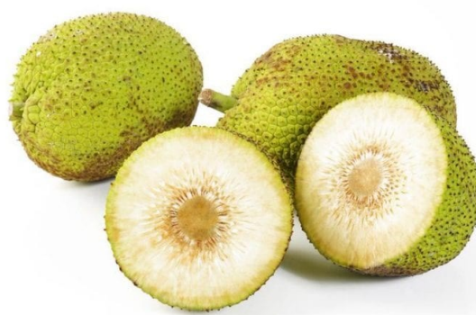
Figura 4. Fruta de pan

El frutipán ( Artocarpus altilis ), el fruto del árbol del pan, originario de Oceanía, cultivado especialmente en las islas del Caribe, aunque también en la Polinesia, Melanesia y Micronesia y América Central, además del Pacífico y en el sureste asiático. El frutipán puede comerse de todas las formas posibles. Crudo y maduro, el frutipán se parece a la chirimoya en textura, aunque más cremoso, pero también posee un sabor muy dulce.