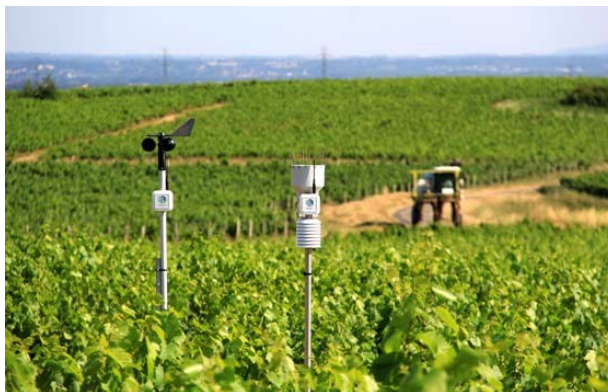
Figura 15. Sensores eléctricos

Los sensores en la agricultura detectan datos fundamentales que permiten evaluar el estado de salud de los cultivos, así como análisis y comparaciones, brindando la posibilidad de planificar sus procesos logísticos. El empleo de estos datos permite reducir el número de mano de obra humana en los campos en actividades de monitoreo, además de limitar el uso de recursos.