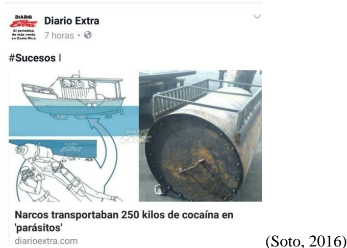
Ilustración 2 Imagen Dos

Dentro de las modalidades resulta importante aclarar ciertos conceptos antes de continuar. Si bien, el traslado de sustancias psicoactivas se ha mencionado como tráfico de droga y entiéndase como: