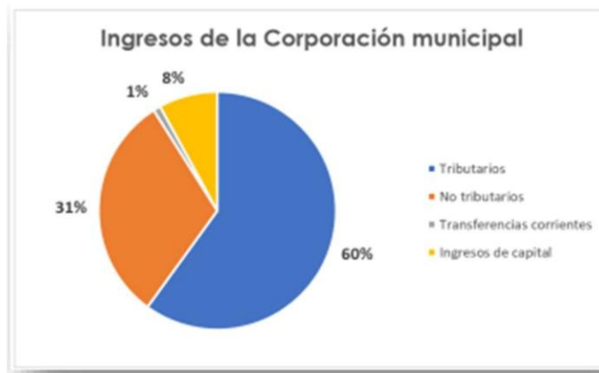
Figura #1 Ingresos de la Corporación Municipal

A continuación, se muestran los ingresos que tuvo la Municipalidad de Tibás en el 2020. La gran influencia que tiene el cobro de los impuestos y el pago de las patentes en la economía del Gobierno ocal tibaseño, aspecto mencionado por el entrevistado.