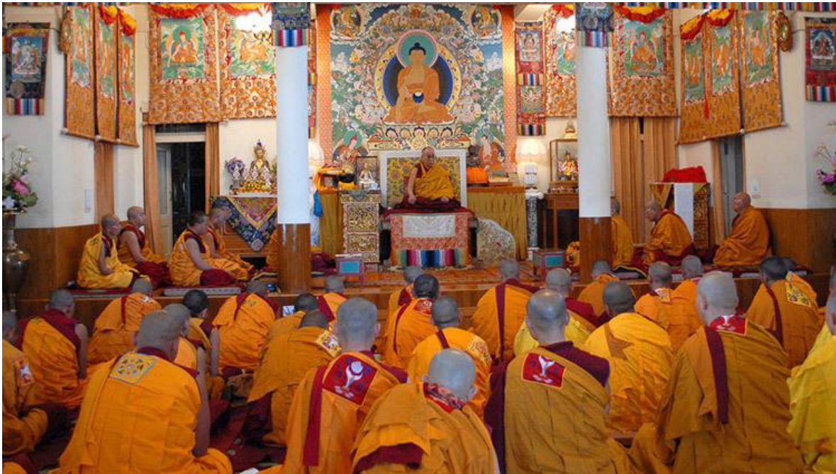
Figura 4. Sociedad budista tibetana en el exilio

Por consiguiente, la finalidad del sueño tibetano es que el dalái lama pueda regresar a su tierra y esta puede alcanzar una autonomía del gobierno de China en donde se respeten los derechos humanos y la cultura budista de esta población.