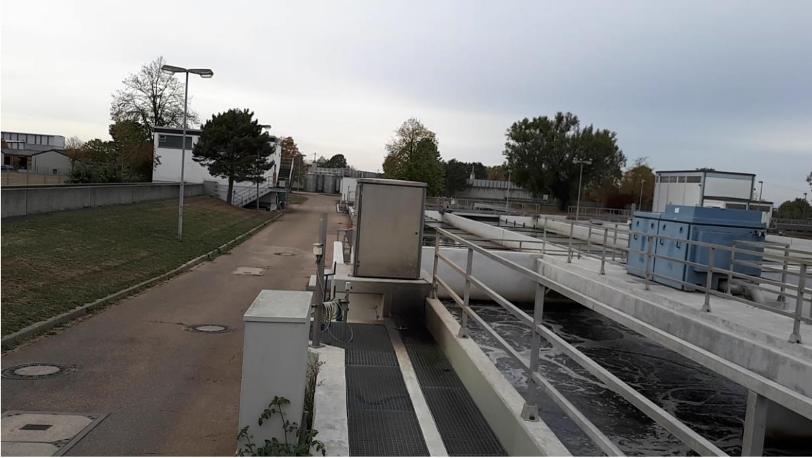
PLANTA DE TRATAMIENTO DE AGUAS NEGRAS EN LAHR