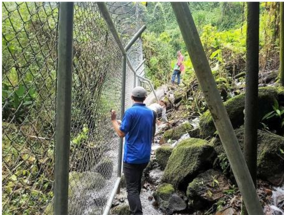
PROYECTOS PARA LA PROTECCION DE NACIENTES DE AGUA Y MEDIO AMBIENTE