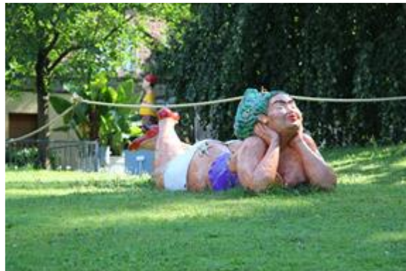
ESCULTURAS EN EL PARQUE DE LA CIUDAD DE LAHR