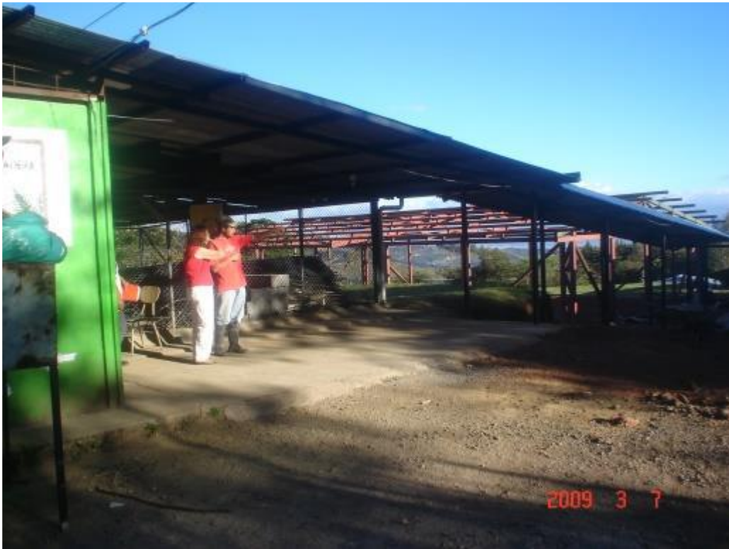
ESCUELA LA PRADERA