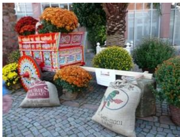
CARRETA TIPICA DE COSTA RICA EN EL PARQUE DE LA CIUDAD DE LAHR