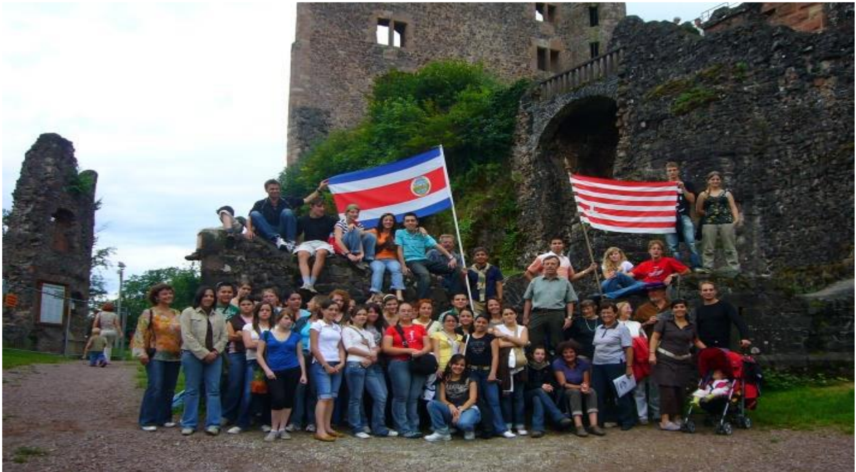
INTERCAMBIO DE ESTUDIANTES EN LAHR