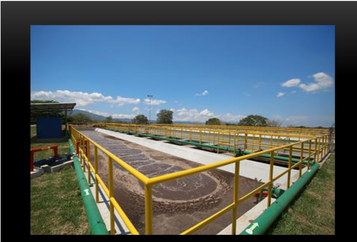
PLANTA DE TRATAMIENTO DE AGUAS NEGRAS EN ALAJUELA