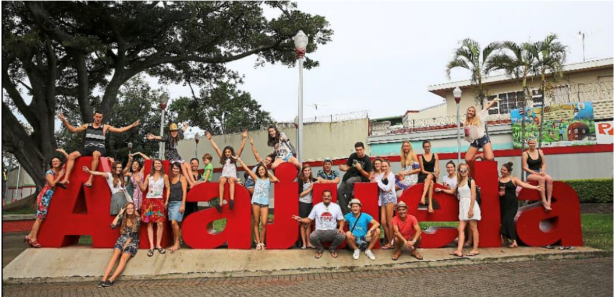
INTERCAMBIO DE ESTUDIANTE EN ALAJUELA