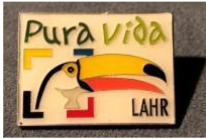
LOGO DEDICADO A LA HERMANDAD