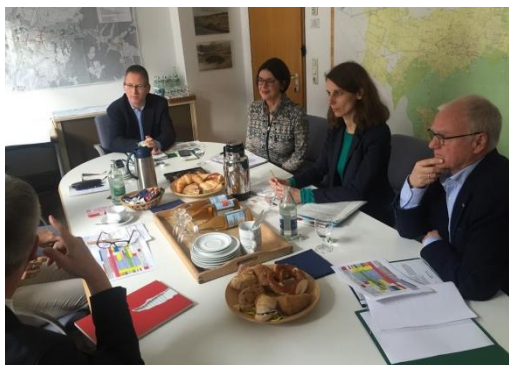
INTERCAMBIO ENTRE EMPLEADOS MUNICIPALES