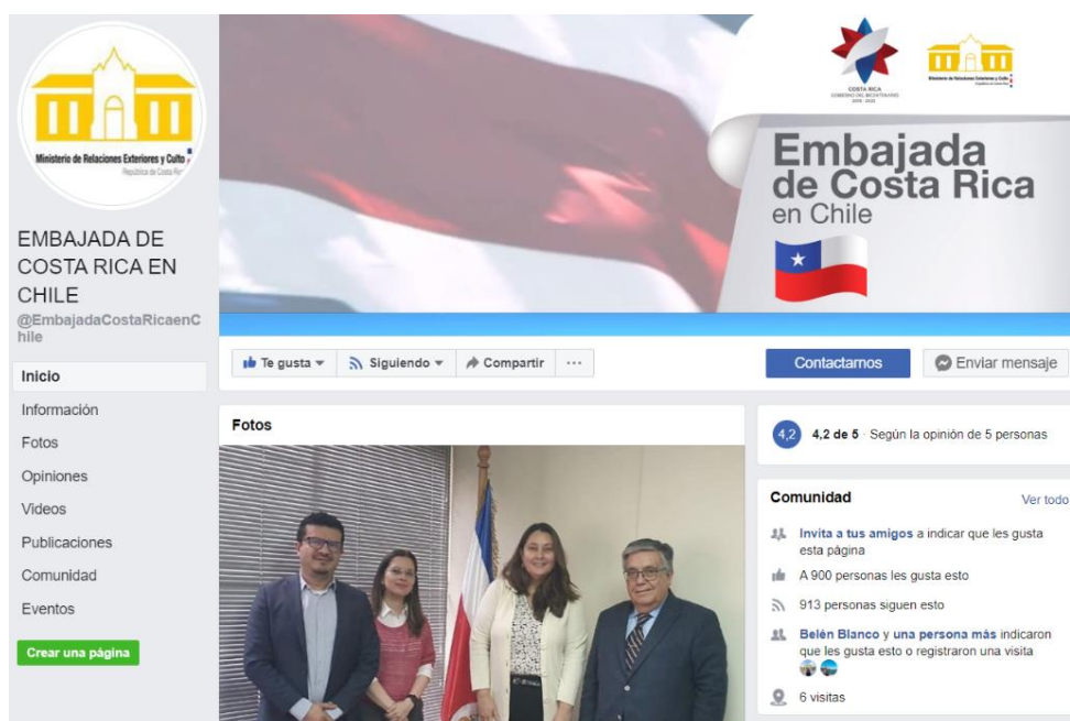
Perfil de Facebook de la Embajada de Costa Rica en Chile.