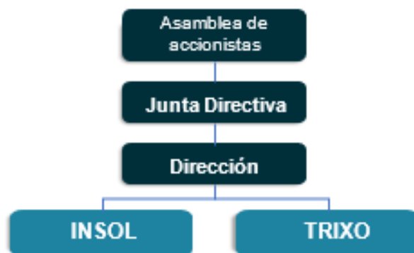
Ilustración 1. Estructura Corporativa