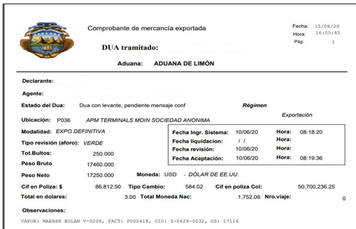
Ilustración 3. Declaración Única Aduanera