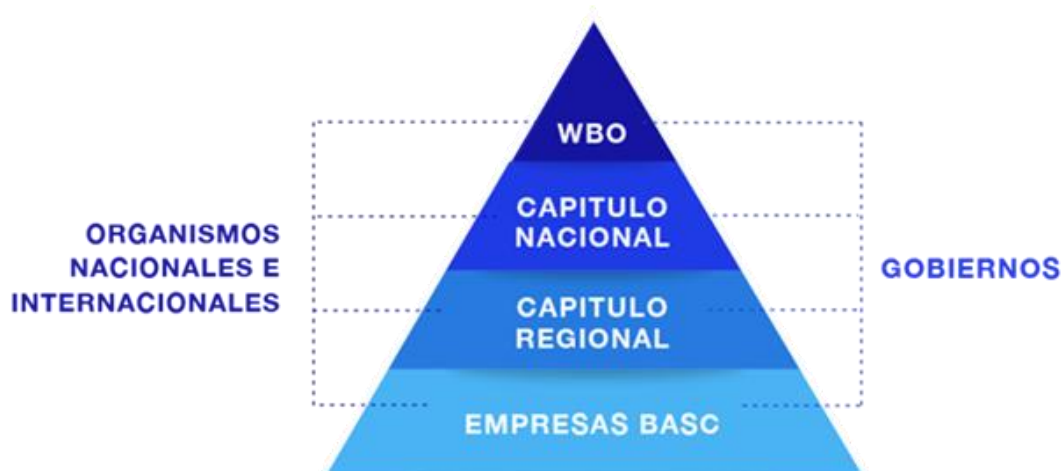
Figura 2: Estructura Organizacional WBO