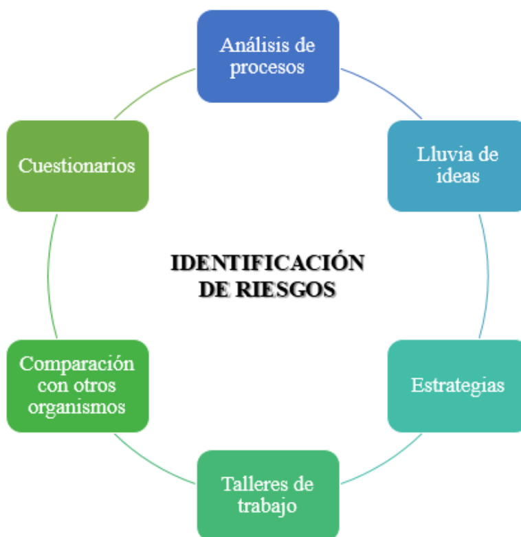
Gráfico 1: Métodos Identificación de Riesgos