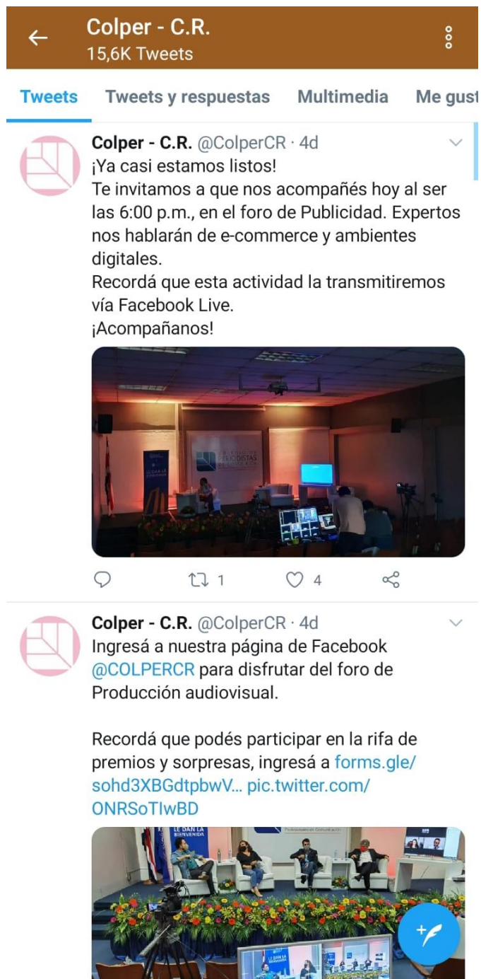
Figura 9: Twitter Colper