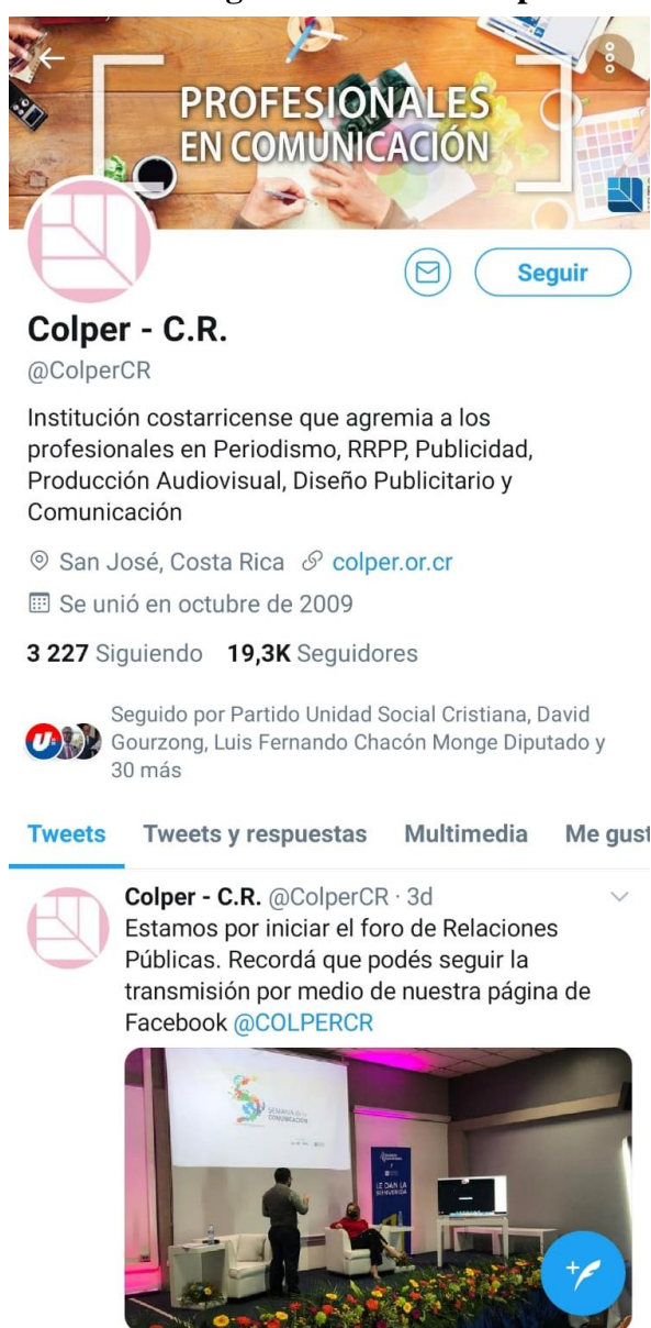
Figura 8: Twitter Colper

A continuación, se muestran imágenes donde se evidencia cómo se ve la página de Twitter del Colper.