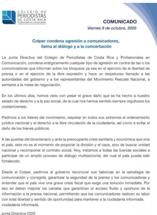
Figura 2: Facebook Colper