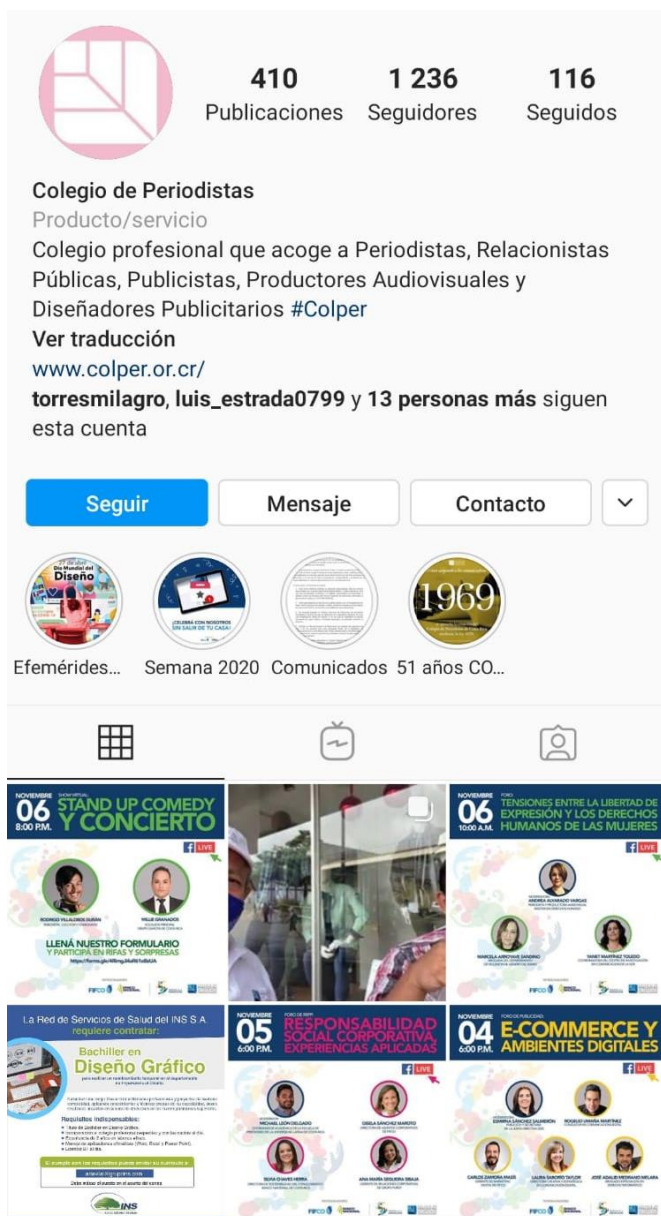
Figura 5: Instagram Colper