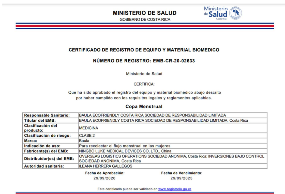
Figura 2.Registro sanitario de copa menstrual (MINSA,2020)

Las mercancías según su naturaleza deben de contar con un registro que permita la inscripción ante el Ministerio de Salud, el cual se puede apreciar en la figura 2; este es un requisito indispensable dentro de la normativa ya que el ente encargado debe de valorar el tipo de bien a manejar, debido a esa razón, el representante legal ya sea persona física o jurídica debe de aportar los requisitos solicitados, el registro sanitario siempre será solicitado cuando se trate de bienes como “alimentos, cosméticos, medicamentos, productos naturales con cualidades medicinales, equipo y material biomédico, productos químicos, higiénicos y plaguicidas y fertilizantes de uso doméstico” (MINSA , s.f.)