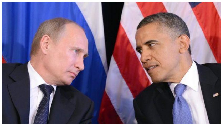
Ilustración 13 Vladimir Putin y Barack Obama

Putin ha visualizado a Estados Unidos como una especie de "aliado obligatorio" si de verdad quieren seguir creciendo. Por ejemplo, después de los ataques del 11 de septiembre a las torres gemelas en Nueva York, Putin ofreció apoyo al presidente Bush en su campaña contra el terrorismo internacional. No obstante, en 2003 Rusia se opuso, como muchos países, a la invasión de Estados Unidos a Irak, lo que deterioró por un corto tiempo las relaciones entre ambos países. Después Rusia firmó el Protocolo de Kioto y Estados Unidos la apoyó para ingresar a la OMC.