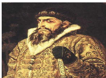
Ilustración 2 Dinastía Rurik, Iván el Terrible