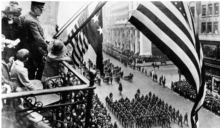
Ilustración 4 Primera Guerra Mundial

La primera guerra mundial estuvo centrada en la triple entente y los imperios centrales surgió entre los años de 1914 y hasta 1919, en la cual más de 9 millones de combatientes perdieron la vida, como antecedente de esto se encontraba la paz armada, el cual surgía por el roce que se daba entre potencia, y como consecuencia de la misma Rusia tuvo que retirarse antes de acabar la guerra ya que su poca industrialización no les permitía estar dentro, al igual se formaron nuevas alianzas y tensiones entre potencias.