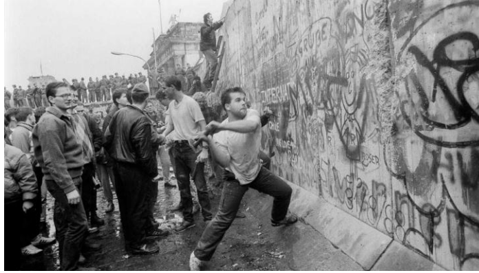
Ilustración 10 Caída del muro de Berlín