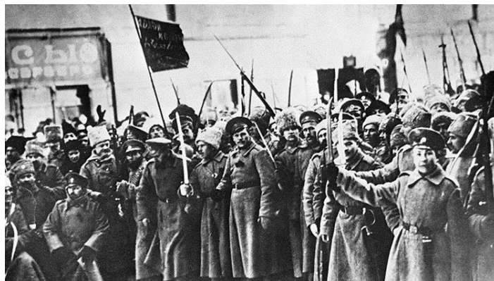
Ilustración 5 La hermosa Revolucion Rusa

Estos acontecimientos se basaron en: El Parlamento nombró un Gobierno Provisional encargado de convocar elecciones a una Asamblea Constituyente, en Petrogrado se constituyó un Soviet de Trabajadores y Soldados controlado por los partidos obrero, y por otro lado el zar Nicolás II cesó en su hermano Miguel el cual quién rechazó el trono, poniendo esto un fin de la dinastía Romanov y se proclamaba la República.