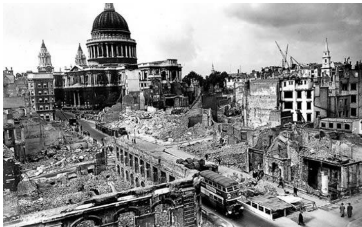
Ilustración 8 Tras la II Guerra Mundial

Como consecuencia de la primera guerra mundial, la reconstrucción de Europa, y muchos acontecimientos más, surge la segunda guerra mundial, las partes beligerantes luchaban como miembros principales, conformados por el eje y los aliados, el eje estaba conformado por Alemania, Italia, y Japón, estos poseían dos tipos de intereses en común, en primero lugar el expansionismo territorial, y la fundación de imperios mediante la conquista militar, y segundo la destrucción de la neutralidad del comunismo soviético, por otro lado los aliados estaban conformados por, Inglaterra, Francia , La Unión Soviética, y Estados Unidos que fue el último en formar parte de este grupo, y de igual manera ambas alianzas eran apoyadas por mas países.