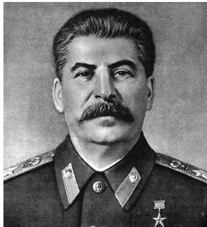
Ilustración 7 Joseph Stalin

Paralelamente, y tras la muerte de Lenin tras sufrir un atentado en 1918 su salud se deterioró y muere en 1924 “tras la muerte de Lenin en 1924, Stalin sube al poder (en contra de los deseos de Lenin, quien prefería a Trotsky) comenzando una época marcada por el terror (buen ejemplo de ello son los tristemente célebres Gulags y el Holodomor, una hambruna provocada en Ucrania que se cobró muchas víctimas) y la industrialización masiva planificada a través de los “planes quinquenales”, basados en la “ teoría de las fuerzas productivas ” (Lubeigt, s/f). Por lo que Stalin gobernó la URSS desde 1929 hasta su fallecimiento en 1953.