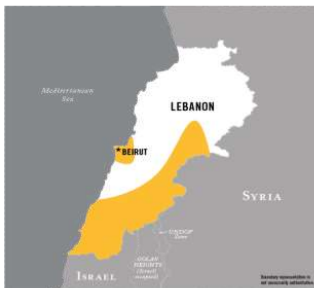
Ilustración Obtenida de Counter Terrorism Guide

En la imagen anterior se puede observar una franja de color amarillo que se impregna en algunas regiones del Estado de Líbano, los territorios en color amarillo son los controlados por la agrupación terrorista Hezbollah, en la imagen se puede visualizar que controla Beirut la capital del Estado del Líbano, gran parte de la frontera con la República de Siria y la totalidad de la frontera con el Estado de Israel.