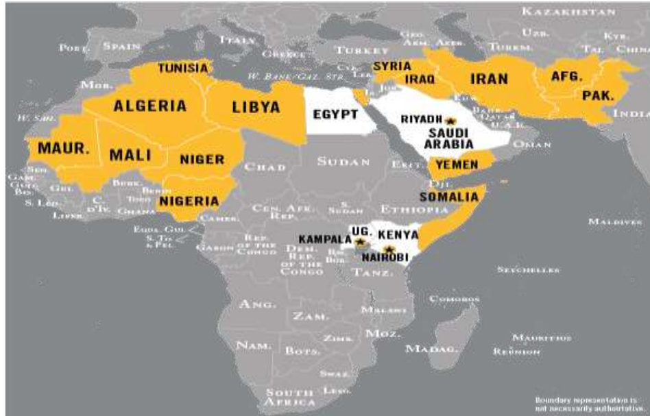
Ilustración Obtenida de Counter Terrorism Guide

En la imagen anterior se puede observar las zonas donde Al Qaeda lleva sus operaciones terroristas o donde está ubicada, por algo se mencionó que el mundo no había presenciado una agrupación terrorista de esta magnitud, hay que tomar en consideración que Al Qaeda crea socios que permiten ejecutar sus operaciones en diversas partes de África, Medio Oriente y Asia.