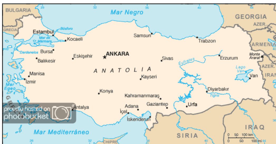
Ver Anexo 6. Mapa elaborado por el Tratado de Lausana.

Para su propósito, recurrió a la organización de comités militares en Anatolia los cuales, terminarían en una pugna histórica conocida como la Guerra de Independencia turca enfrentando, principalmente, a Grecia que ocupaba las regiones de Anatolia occidental y Tracia. Eso sumado a la eliminación tropas de entente que, permanecían en territorio turco, permitiría a Kemal declarar la victoria final tomando como primera medida con esta liberación del país, la abolición del sultanato para evitar que el gobierno que existía con anterioridad se inmiscuyera en los asuntos de negociación de la paz, reflejado En el Tratado de Lausana que acabó con la guerra, puso los límites actuales de la Turquía y logró la adhesión a la sociedad de naciones.