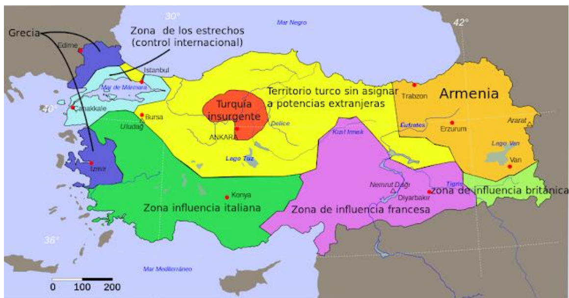
Ver Anexo 5. Mapa elaborado por el Tratado de Sèvres.

Esa guerra mundial es ganada por las potencias aliadas que decidirían con el Tratado de Sèvres de 1920, disolver el Imperio Otomano. Ahora bien, llegados a ese punto aparecería en escena Mustafá Kemal reconocida figura en el ambiente militar y político de Turquía. Su intención fue destruir y anular por completo el tratado antes mencionado y conformar un país con derivaciones de las formas europeas de Estado nación.