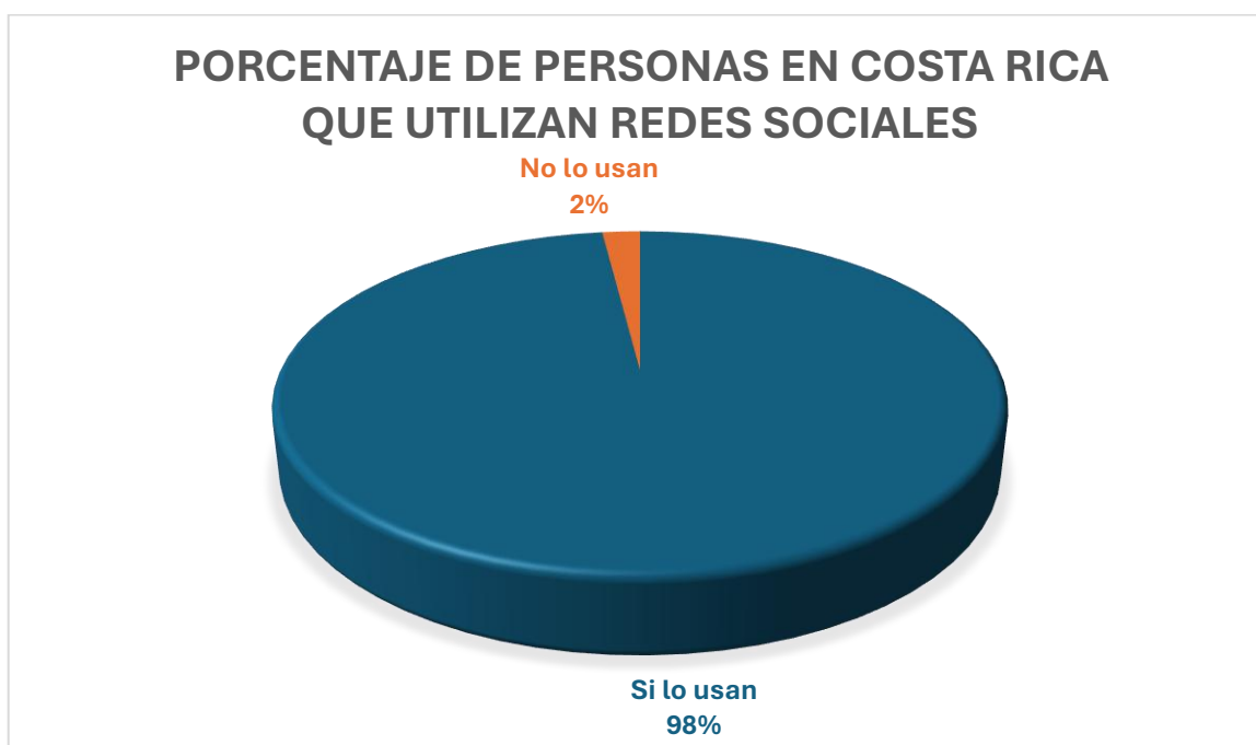
Figura 1: Porcentaje de personas en Costa Rica que utilizan redes sociales

Según lo indicado en la información recopilada a través del método del análisis documental, cerca del 90 % de la población en Costa Rica utiliza redes sociales y el 98 % aplicaciones de mensajería, que se encuentran recopiladas en las tecnologías de comunicación e información, es decir, las TIC.