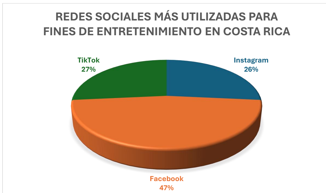
Figura 2: Redes sociales más utilizadas para fines de entretenimiento en Costa Rica