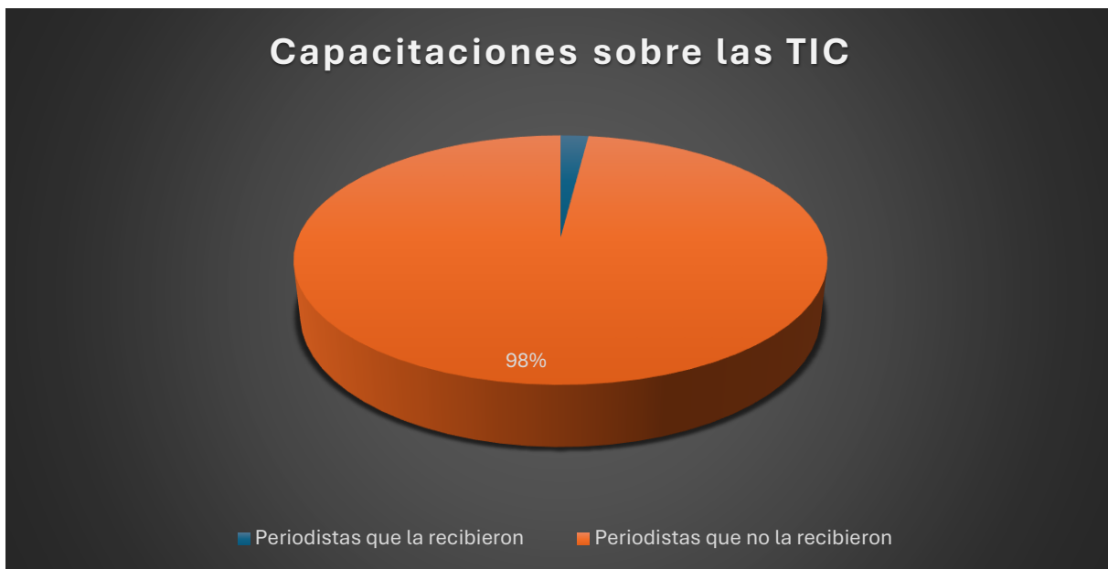
Figura 5: Capacitaciones que han recibido los periodistas deportivos sobre Tecnologías de la Información y Comunicación

Se ha determinado que para el comunicador actual es esencial, no solo en la faceta deportiva, sino en el periodismo convencional, buscar información relacionada a los cambios en las estrategias para compartir información a la población por medio de las plataformas digitales, páginas web y otras tecnologías de comunicación e información. En consecuencia, los medios también deben ofrecer a sus empleados capacitaciones actuales sobre las TIC con el objetivo de brindarles un mayor conocimiento respecto a las nuevas tecnologías, para favorecer tanto a los profesionales como al propio medio de comunicación; sin embargo, con la información recopilada en las entrevistas de profundidad, solo el 2 % de la muestra indicó que recibieron una capacitación, lo que refleja el poco o nulo interés por llevar a cabo capacitaciones en este apartado.