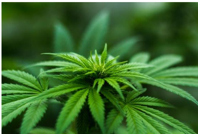
Ilustración 1 Planta de cáñamo

Según la Real Academia Española RAE (2020) el cáñamo se define de la siguiente manera “El cáñamo viene del lat. Cannābum, por cannābis. Planta anual, de la familia de las cannabáceas, de unos dos metros de altura, con tallo erguido, ramoso, áspero, hueco y veloso, hojas lanceoladas y opuestas, y flores verdosas”.