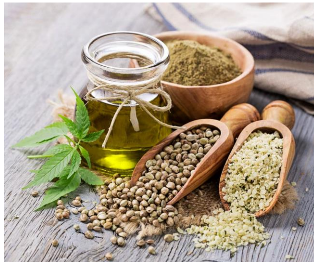
Ilustración 2 Variedades, propiedades y usos.