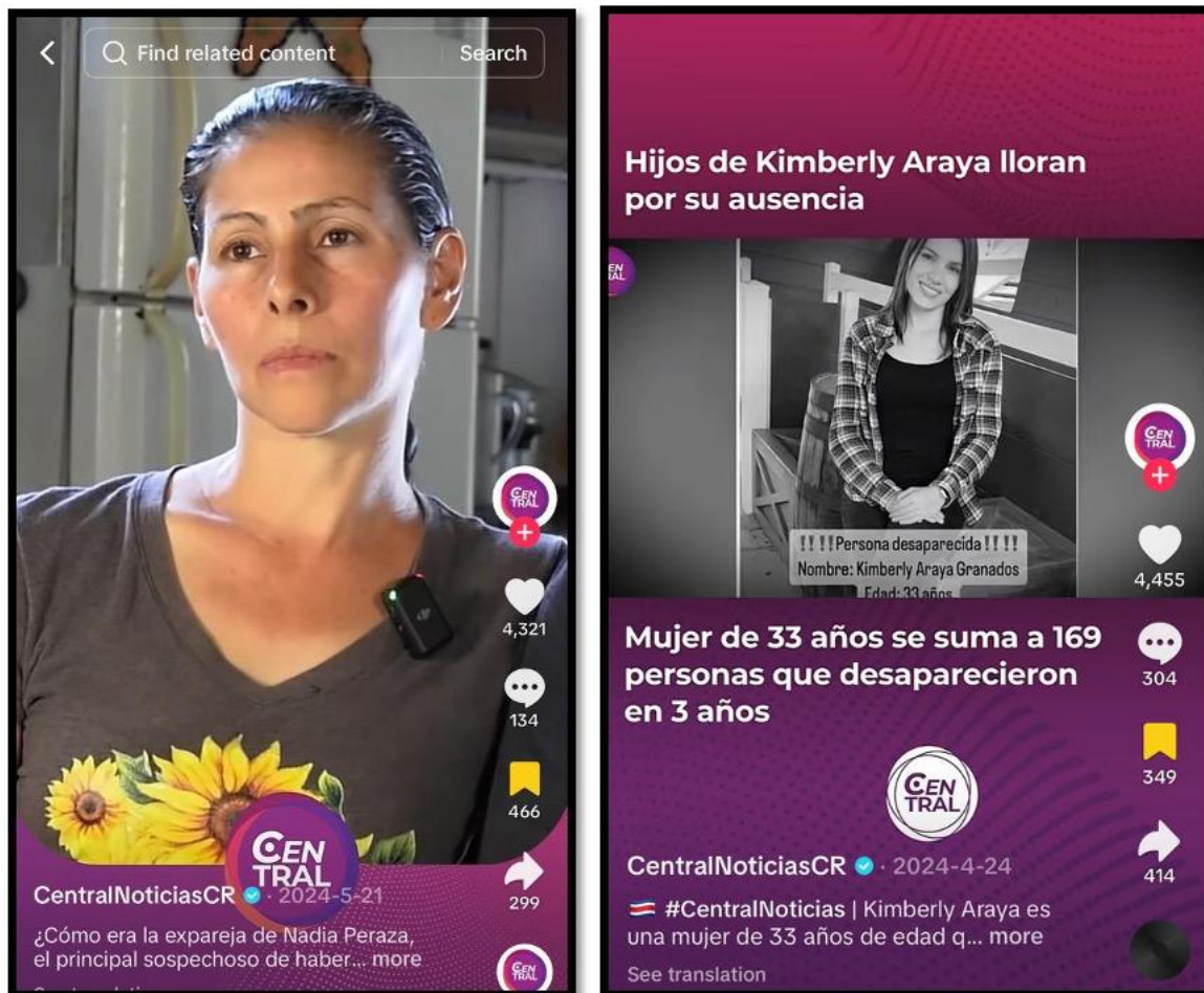
Ilustración 5. Publicaciones en video que crean espectáculo o no llaman al suceso femicidio