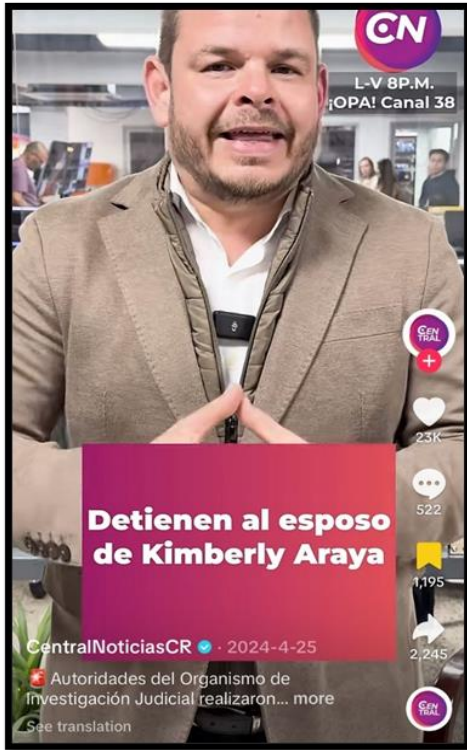
Ilustración 1. Publicaciones en TikTok sobre casos de femicidios de Central Noticias