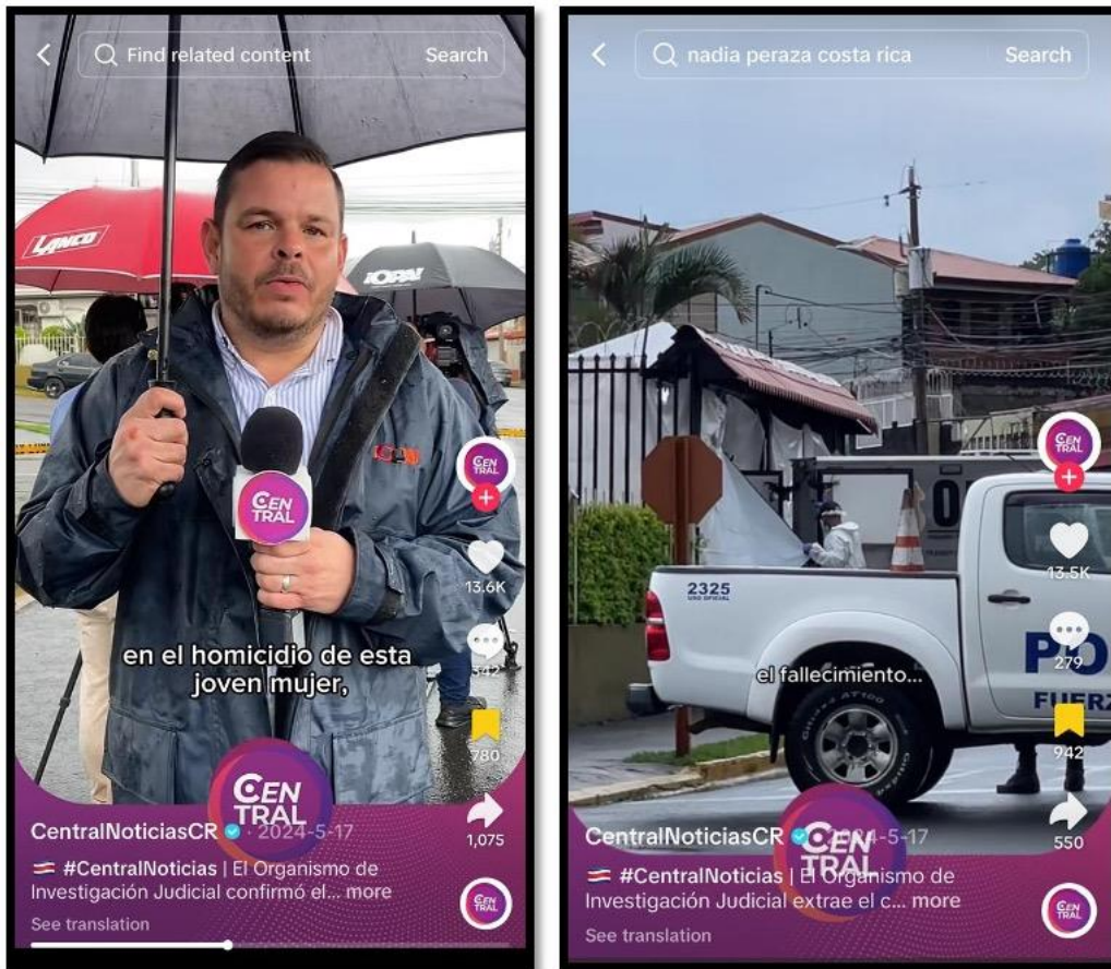
Ilustración 4. Publicaciones que crean espectáculo o no llaman al suceso femicidio